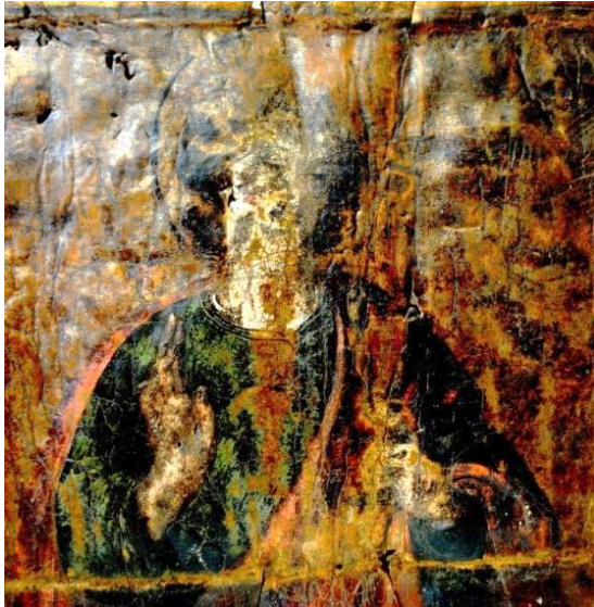
Fig. 5 : détail du buste de saint Jean.