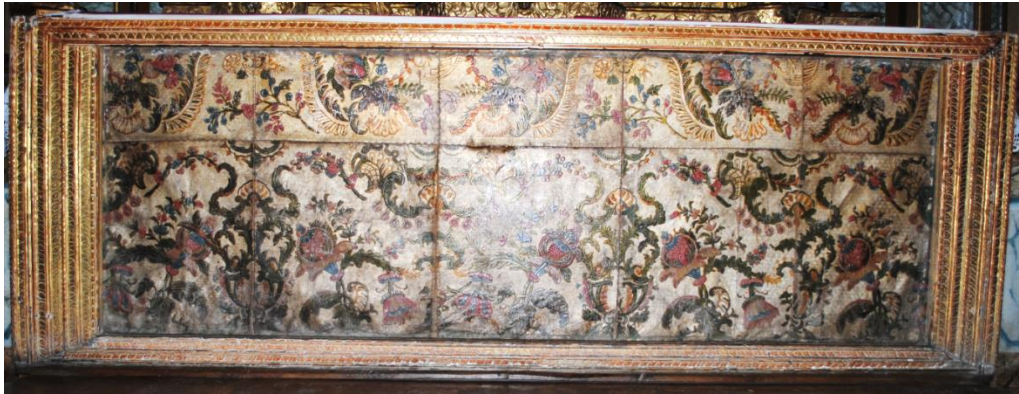
Fig. 7 : devant d'autel de l'église d'Aucun.