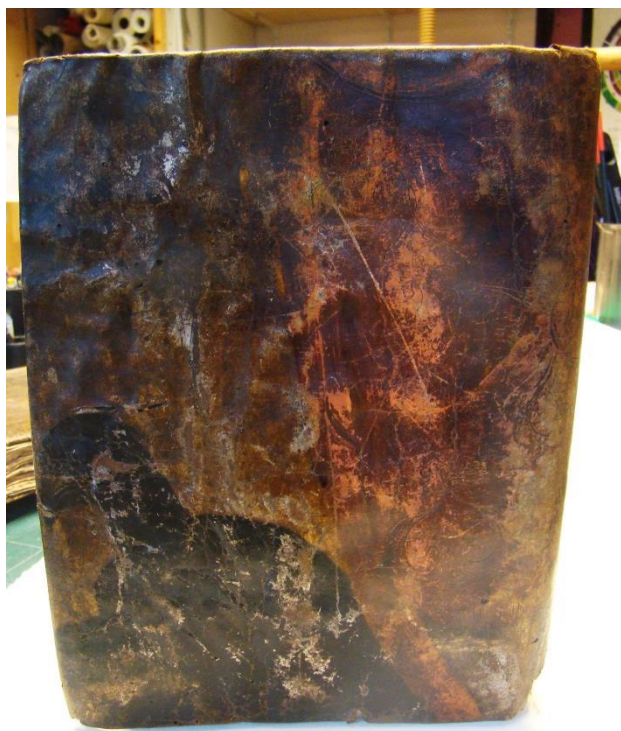
Fig. 1 : couverture d'un registre avant démontage. On perçoit la dorure et un animal peint (O. Ixart).

En décembre 2015, à l'occasion des travaux de restauration, avant numérisation, de ces deux registres datant du 18 e siècle, Olivier Ixart, relieur-restaurateur aux Archives départementales, a perçu des éléments de couleurs et dorure sur les couvertures (fig. 1). 4 Averti, le directeur, François Giustiniani, a autorisé le démontage des reliures, révélant qu'elles provenaient d'une même peau, décorée d'un personnage peint dont l'intégralité a pu être restituée par l'assemblage des deux pièces (fig. 2). Seules manquent certaines parties marginales du fait des coupes dues au pliage pour la reliure.