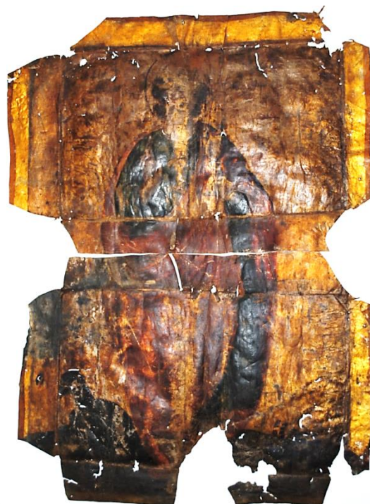
Fig. 2 : vue d'ensemble des deux peaux assemblées.