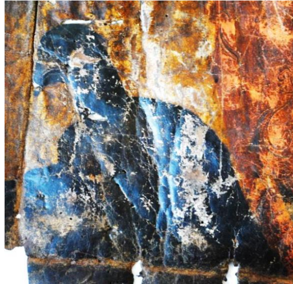
Fig. 6 : aigle.